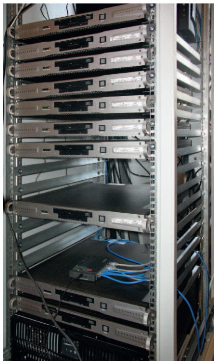
Рис. 1. Стойка серверов Advantix в едином диспетчерском центре города

или в режиме реального времени. Все объекты были разделены на несколько типовых групп. Внутри групп однотипные объекты можно легко сравнивать, выявлять факты неэкономного расходования ресурсов, фиксировать аварийные ситуации и наблюдать за их развитием или устранением. Умелое использование системы позволило руководителям некоторых объектов коммерческой недвижимости экономить сотни тысяч рублей ежемесячно. И это при том, что удельная стоимость внедрения составила менее 500 тыс. рублей на объект. На рис. 1 показана серверная стойка единого диспетчерского центра города.